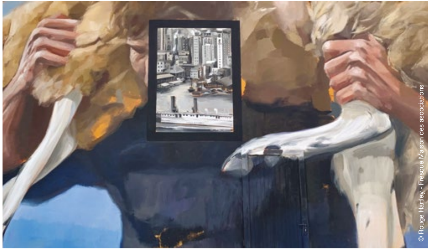
© Rouge Hartley - Fresque Maison des associations