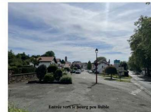
Entrée vers le bourg peu lisible