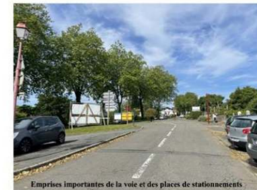
Emprises importantes de la voie et des places de stationnements