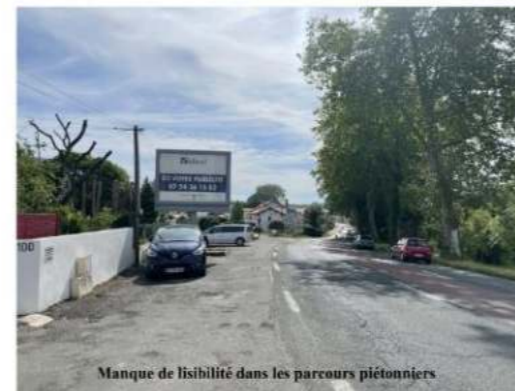
Manque de visibilité dans les parcours piétonniers