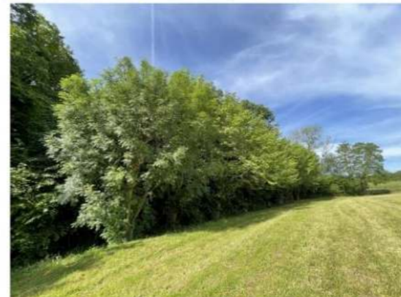
Mélange Platanes, Frênes, Aulnes, Chênes, Acacias