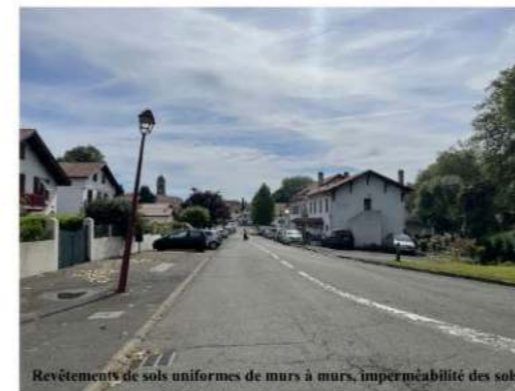
Revêtements de sols uniformes de murs à murs, imperméabilité des sols